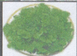
กรีนโอ๊ค