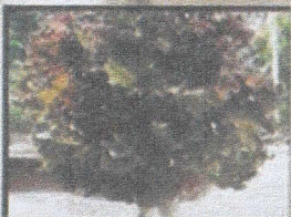
เรคคอรัล