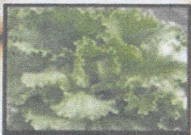
กาดแก้ว (ไม่เคี้ยว)