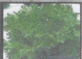
ฟิชเลย์ (ไม่เคี้ยว)