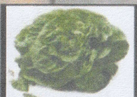
บัตเตอร์เฮด